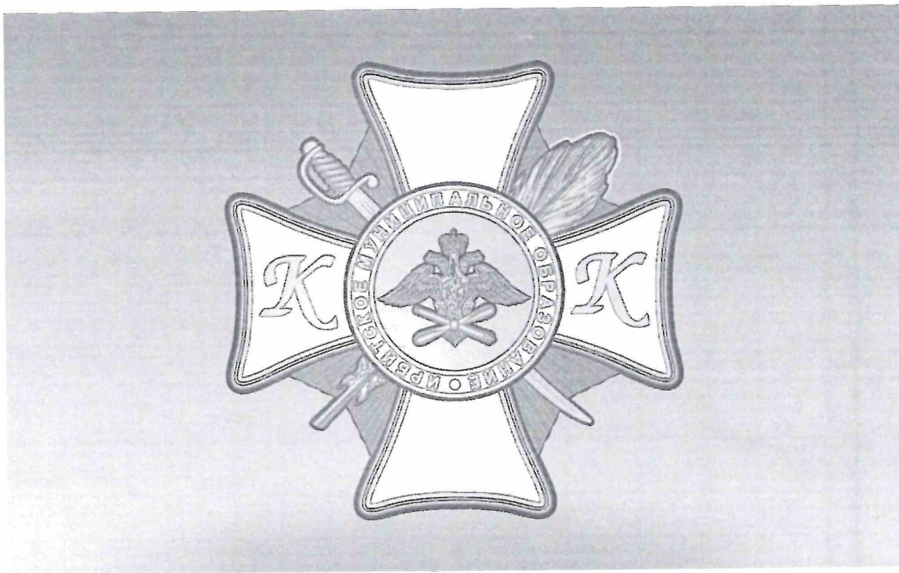
Рисунок нагрудного знака «Выпускник кадетского класса Ирбитского муниципального образования»